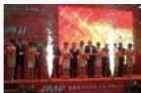
La Pro.Mec ha aperto in Cina

prio organismo». Se gli effetti della crisi non si sono fatti ancora sentire, «è merito – prosegue Scarpa – anche degli ingenti investimenti in ricerca e sviluppo che fanno dell'industria farmaceutica italiana un vero e proprio fiore all'occhiello del settore». Duemiladieci positivo anche per la PMP Pro-Mec spa di Coseano, multinazionale della meccanica di alta precisione specializzata nel ramo trasmissioni