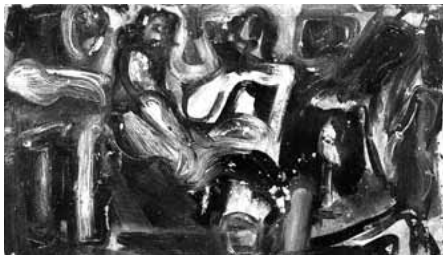
Emilio Vedova, studio interno con figure - 1940/41 olio su cartone cm 15x24

Opere storiche del Gutai, dell'Azionismo, dell'Arte Povera, della Transavanguardia, del grande Informale Europeo, del Graffitismo americano, del Cinetismo-Optical Art, dell'Espressionismo astratto americano, del Nouveau Realisme, dell'Arte Contemporanea Cinese ed estremo-orientale, delle grandi avanguardie internazionali che portano la firma di autori presenti nei più prestigiosi musei d'arte moderna e contemporanea. Oggetti desiderati ardentemente dai collezionisti più raffinati, sempre a caccia del pezzo giusto per arricchire la propria collezione. Dove trovarli? La risposta è semplice. Né da Sotheby's, né da Christie's e né tantomeno da Philips de Pury, bensì tra le mura di palazzo Scaini, nella casa d'aste e galleria udinese Artesegno ( www.artesegno.com ). Una realtà friulana che forse non tutti conoscono ma che sorprende per la sua complessità e ricchezza, per l'ampia proposta di opere d'arte capace di soddisfare persino l'esperto più informato e preparato. Nata nel 1991 come galle-