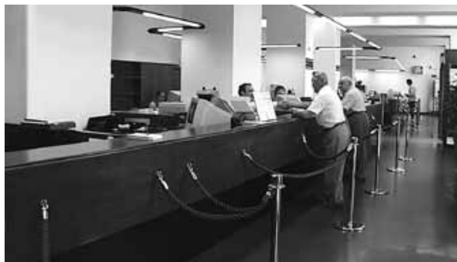
Confidi Friuli quest’anno ha stipulato convenzioni con i principali istituti di credito presenti sul territorio

Il Fondo, infatti, si propone di agevolare l’accesso al credito da parte delle piccole e medie imprese per favorirne lo sviluppo sul territorio. In questo modo, contando sulle garanzie dei Confidi, potranno richiedere con più facilità finanziamenti alle banche. In particolare, lo strumento garantirà le operazioni finanziarie realizzate da banche e intermediari autorizzati in favore delle stesse Pmi per numerose iniziative,