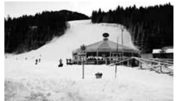
L'arrivo della pista Di Prampero dove si disputerà la coppa del mondo di sci femminile nel 2011