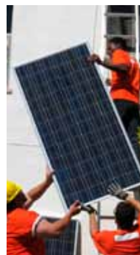
L'obiettivo è creare una filiera dell'energia

concrete e alle caratteristiche del tessuto socio-economico regionale». Il 2011 ha inoltre in programma due appuntamenti fondamentali per Legacoop: il 4 marzo si