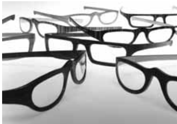
Occhiali in esposizione a Udesign

Ognuno degli oggetti esposti nella mostra "Udesign", nella chiesa di San Francesco, riassume in sé quella doppia dimensione sempre più necessaria per consentire a un'impresa di essere competitiva: quella locale – sono tutti prodotti di aziende, anche piccole e piccolissime, della provincia di Udine – e quella globale – sono tutti prodotti di aziende aperte al mondo e all'internazionalizzazione. La sede è stata perfetta, a inizio dicembre, per ospitare il primo seminario che la Camera di Commercio ha dedicato al tema del design: il primo di una serie, espressione d'approfondimento di un progetto articolato che si svilupperà in questi mesi come felice corollario alla mostra promossa dal Comune di Udine. L'iniziativa, finanziata dalla legge regionale 1/2005 e portata avanti congiuntamente agli enti camerale di Gorizia, Pordenone e Trieste, prevede anche incoming di operatori stranieri del settore e attività d'orientamento pre-competitivo, con cui le imprese, grazie all'aiuto di un esperto, possono verificare il loro grado di "preparazione" su un carattere, quello del design,