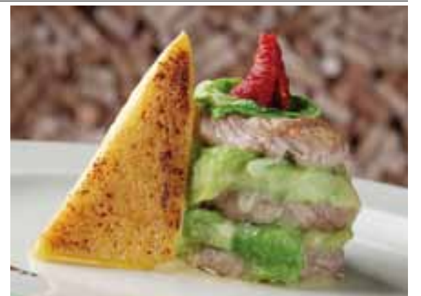
Maialino con verze

è consolidata negli anni, attraverso anche un importante radicamento nel territorio, dove è sempre viva la ricerca per prodotti di alta qua-