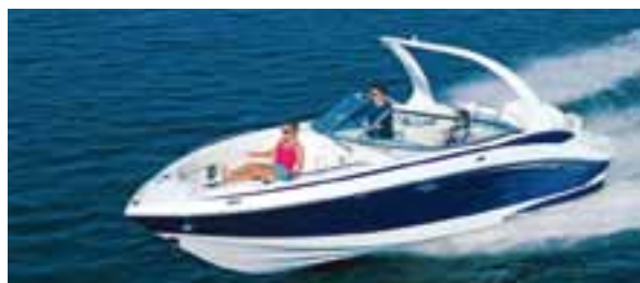
La Blupassion è stata reinaugurata dopo il maltempo