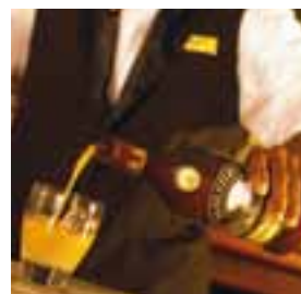
I bar sono alle prese con il nuovo codice della strada