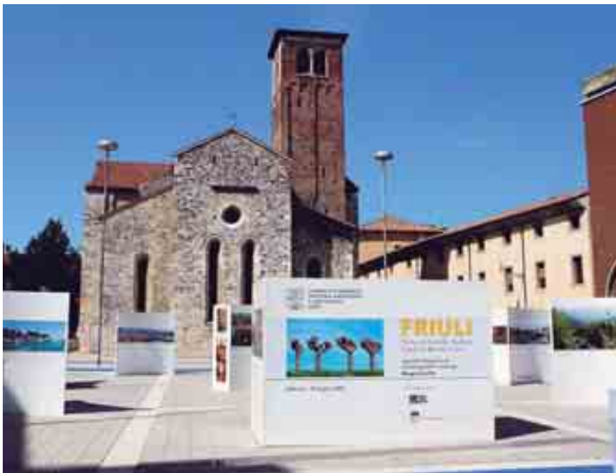
Panoramica di Piazza Venerio. Durerà fino al 30 luglio la mostra "Friuli. Terra di larghe vedute"

Circondati di giallo, il colore dell'oro, di ciò che non dovrebbe conoscere corruzione, i gelsi capitozzati, le loro rughe e i loro nodi rinvigoriti dalla primavera sono l'icona della mostra Friuli. Terra di larghe vedute che la Camera di Commercio ha affidato a Diego Cinello e Armando Mucchino. Allestita da Mauro Vale in piazza Venerio, consente un itinerario tra luoghi e paesaggi della "piccola patria". La prima figura descrive l'arco delle Alpi friulane viste dal colle di Fagnagna: Cinello l'ha costruita e proposta nel 1997, ma ora e qui ritorna con altri intenti e con altro spirito. L'autore sembra ripetere Giovanni Marinelli: "Io stento sempre a capacitarmi che l'abitante del deserto o delle pampas abbia una patria. Per amare, per sentire questa patria, è d'uopo che essa abbia un profilo". Armando Mucchino, mentre avverte le emozioni che Cinello condivide con il presidente della Società Alpina Friulana, indica nei silenzi e nel non-visibile il senso di questo "paesaggio". Inseguire con lo sguardo e con l'obiettivo la teoria delle Alpi friulane non è mero "vedere"; significa riconoscere i confini del Friuli secondo storia e memoria, ammettere lo spessore del nostro inconscio, predisporre a riflessioni e pensieri che il castello di Udine visto dal campanile del duomo assieme con le Alpi Giulie riapre. Dopo la cornice alpina, dopo la città come principio, Cinello, cucendo fotogramma a fotogramma, disegna il Friuli profondo dei fuochi epifani-