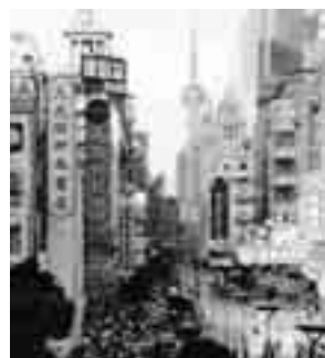
Vedute di Shanghai

è anche "saper comunicare" con la controparte cinese che interpreta modi di pensare non usuali alla cultura occidentale. Questo pensiero è stato lo spunto per proporre il 29 giugno presso l'Azienda Speciale Promecon della Cciaa di Pordenone una giornata tecnico/conoscitiva, inserita nelle attività "Progetto Cina". Una giornata che ha trovato un significativo riscontro da parte di circa