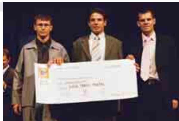
I vincitori del premio internazionale, Jopede Travel Portal

Star Track: costituito da otto membri delle università di Udine e di Pa-