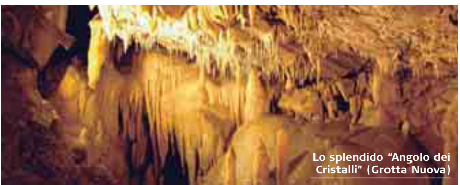
Lo splendido "Angolo dei Cristalli" (Grotta Nuova)

Altri alberghi diffusi sono presenti anche a Comeglians, a Sutrio, sull'altopiano di Lauco, e nella Val Degano (Il Grop) dove sono nati con l'obiettivo di offrire itinerari culturali per comprendere la storia della Friuli, organizzare visite guidate con percorsi naturalistici per conoscere ed apprezzare il territorio, scoprire le tipiche attività artigianali, partecipare ai riti della comunità, condividere usi e costumi, imparare a cucinare e gustarne le specialità gastronomiche di questa particolarissima zona del Friuli. Da quest'anno poi ogni albergo diffuso avrà un suo piatto tipico che contribuirà ad accrescere l'ospitalità con l'obiettivo di ottenere un unico circuito gastronomico.