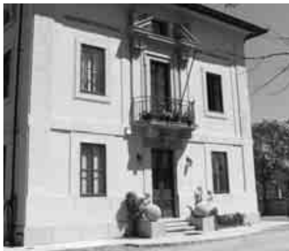
La sede del Consorzio Poiana a Cividale in Via Duca degli Abruzzi 1

cace ed efficiente, a tutela dell'ambiente e del cittadino". Partecipano all'Acquedotto Poiana Spa i Comuni di Cividale, Buttrio, Corno di Rosazzo, Manzano, Moimacco, Pavia di Udine, Pradamano, Premariacco, Remanzacco, San Giovanni al Natisone, Trivignano Udinese e San Pietro al Natisone, per un totale di 2.000.000 azioni. "Distribuiamo acqua - dice Marseu - mediamente 360 litri al secondo attraverso una rete di condotte adduttrici su circa 780 chilometri, con 15 serbatoi di accumulo e compensazione. Le tubazioni sono realizzate in vari materiali tra cui prevalgono acciaio e ghisa sferoidale". Le captazioni di acqua potabile avvengono sia da sorgenti - Poiana e minori a Pulfero e San Pietro - sia da pozzi localizzati a San Nicolò di Manzano, a San Giorgio di Cividale e, prossimamente, a Ziracco. "Da alcuni anni l'Azienda opera anche nella gestione delle acque reflue, nei servizi