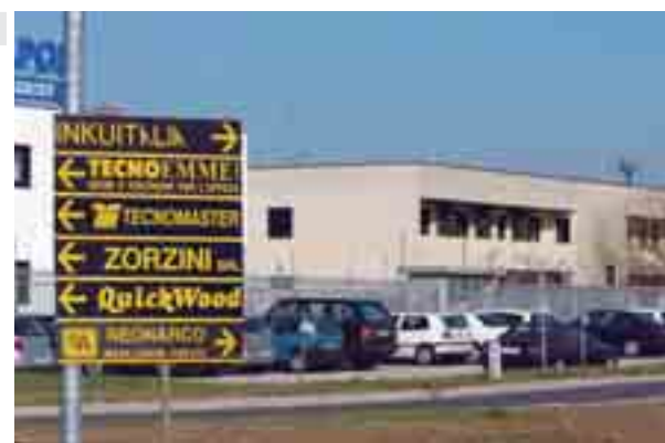
Tempi duri per le aziende della Ziu prive dell'Adsl