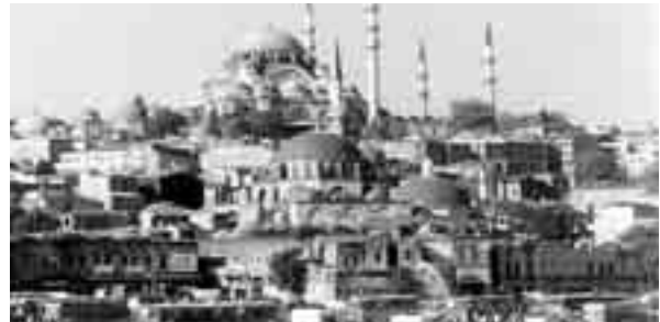
Aziende friulane saranno presenti a Istanbul dal 17 al 20 settembre

L'iniziativa, che si rivolge alle Piccole e Medie Imprese regionali ed è mirata ad approfondire la conoscenza del mercato turco e ad offrire alle aziende potenziali opportunità di business tramite incontri bilaterali e workshop con controparti turche preselezionate, rappresenta l'evento di concretizzazione delle attività di progetto (presentazione paese, seminari tecnici), da ultima la giornata