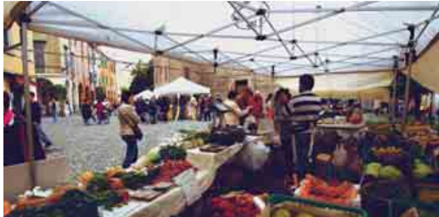
L'Associazione italiana per l'agricoltura biologica ha piazzato la nostra regione in fondo alla classifica nazionale